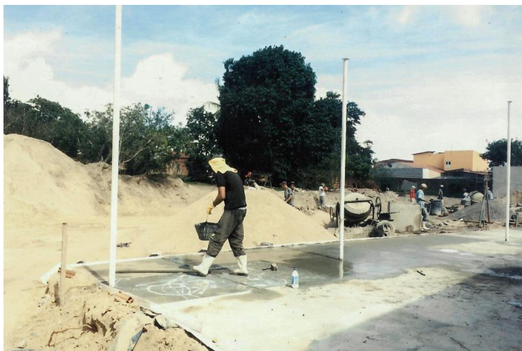
Obra de ampliação de sala de aulas e laboratórios ainda em execução – Novembro 2019

Está previsto no orçamento de 2020, uma reestruturação nos laboratórios, novas salas de aula que já se encontram em construção, ampliação da clínica escola de nutrição para receber a clínica de atendimento em psicologia e fisioterapia, modernização do acervo de computadores e softwares instalados.