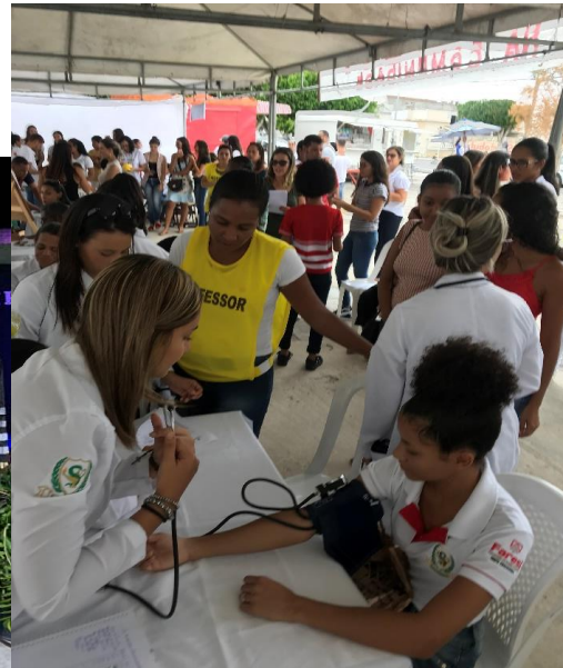
Eventos de enfermagem realizados em 2018/2019