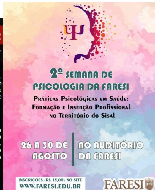
Eventos de Psicologia realizados em 2019